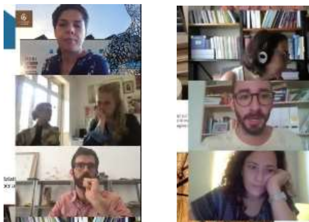
Οι εταίροι του έργου κατά τη διάρκεια της 3 ης συνάντησης

Η σύμπραξη εξέτασε την πρόοδο του έργου και τις δραστηριότητες για το επόμενο εξάμηνο.